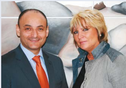
Abed Daka Apotheke am Bauhaus

Um telefonische Voranmeldung wird gebeten. Wir freuen uns auf Ihren Besuch